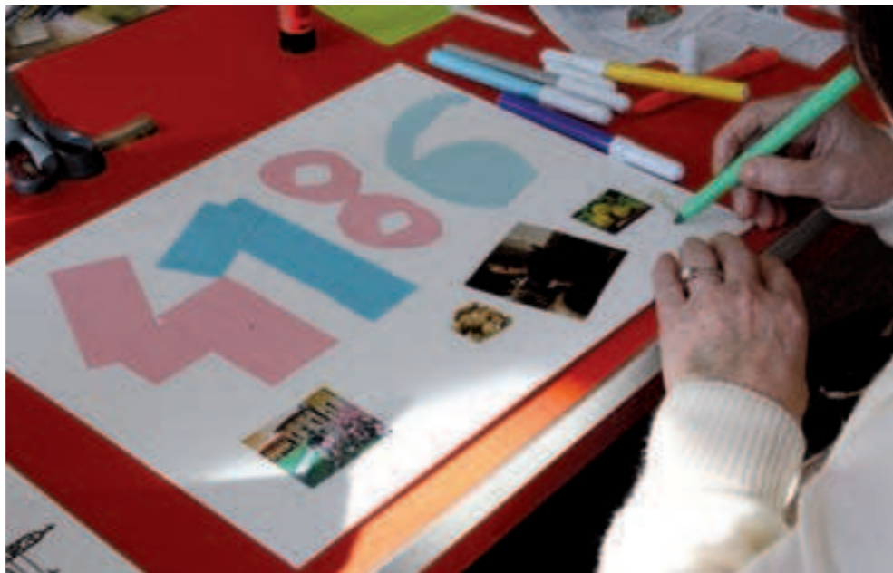
↑↑ | ↑ Le Opere 4'183 e 4'186 in preparazione